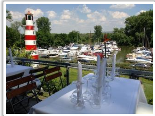
Blick auf den Yachthafen

130qm Innenfläche und über 500qm Aussenfläche sind perfekt für verschiedene Arten von Veranstaltungen.