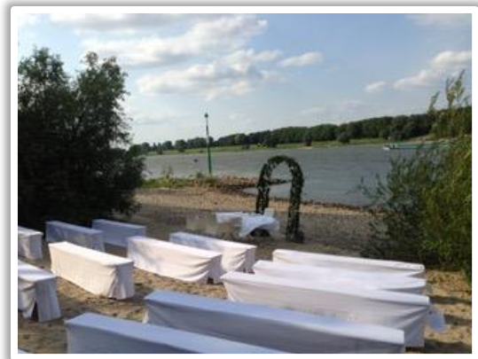
Freie Trauung am Paradiesstrand